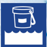
Desinfección & Mantenimiento