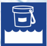
Desinfección & Mantenimiento