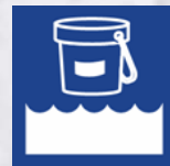
Desinfección & Mantenimiento