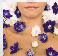
Zona de tratamentos