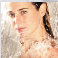
Zona de águas